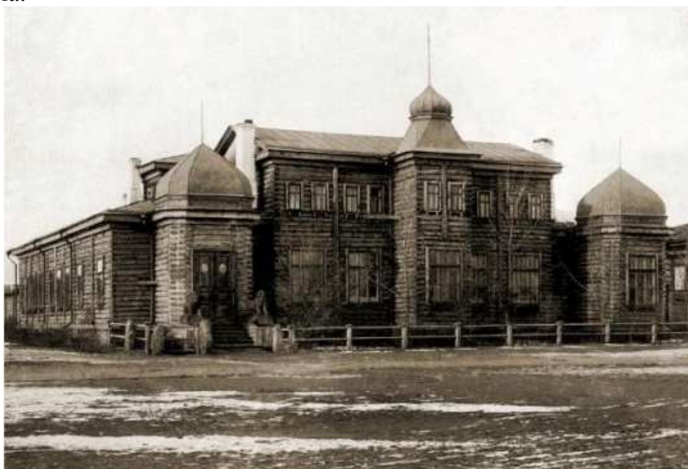
Здание ЗСОПГО в Омске

Область научных интересов - интегральные уравнения типа Фредгольма.